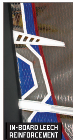
IN-BOARD LEECH REINFORCEMENT